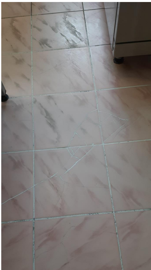
2. Напольное покрытие в горячем цехе.